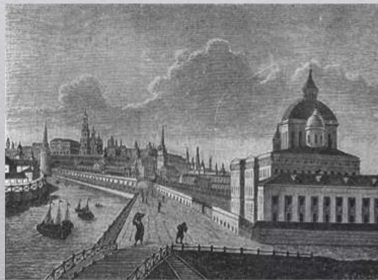
Первоначальный вид Воспитательного дома в Москве

В 1775 году были открыты совестные суды , к ведомству которых было отнесено рассмотрение преступлений, совершенных малолетними.