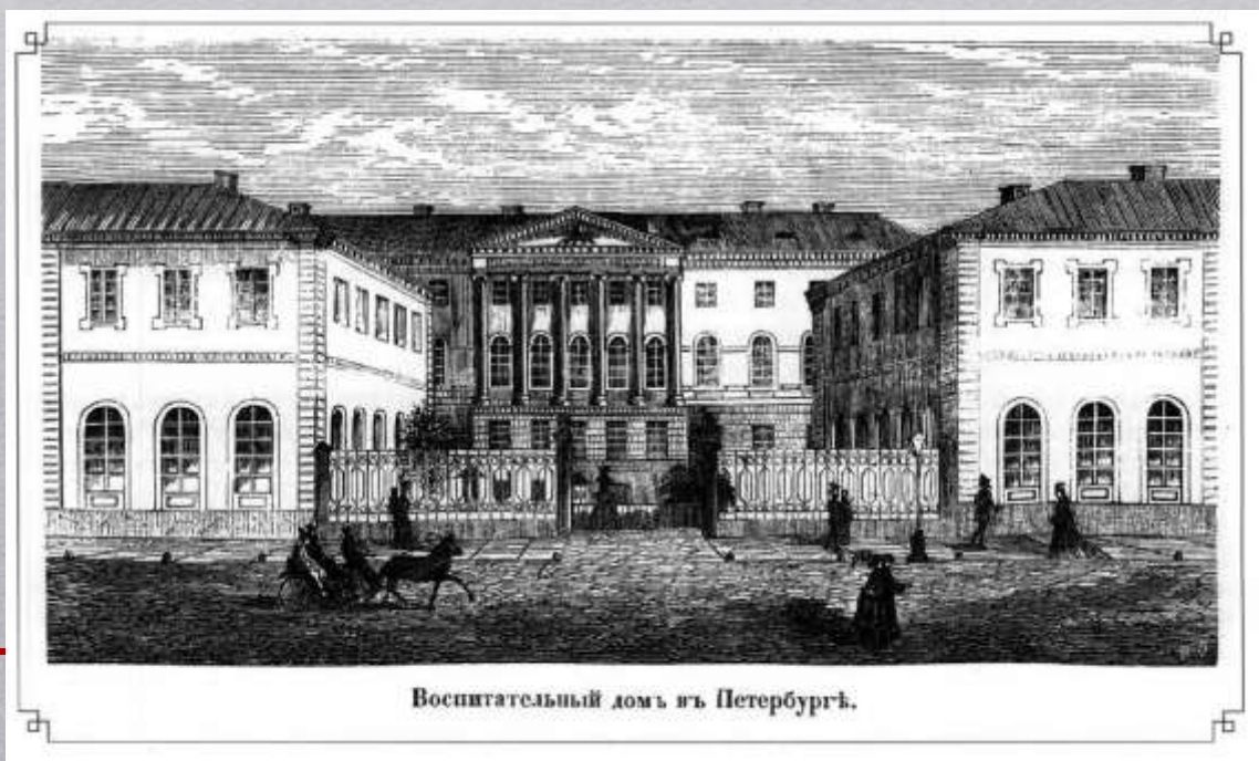
Воспитательный домъ въ Петербургѣ.

В 1775 году были учреждены сословные органы опеки , среди которых – дворянская опека для малолетних.