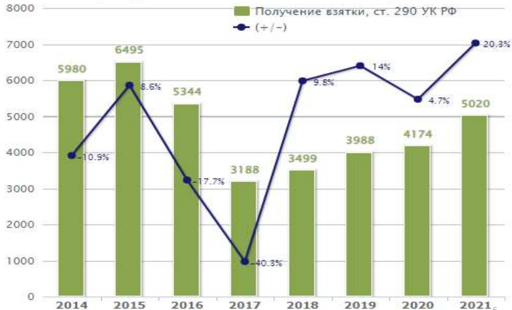
Динамика преступлений по ст. 290 УК РФ (Получение взятки)